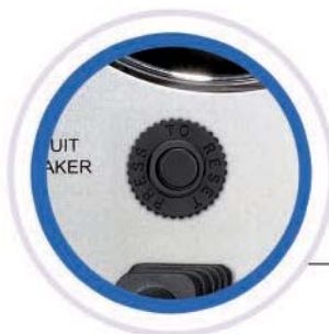
Protección de sobrecarga