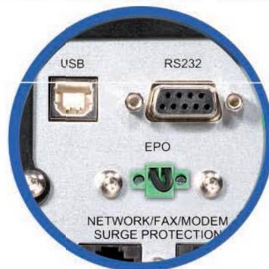
puertos de comunicación