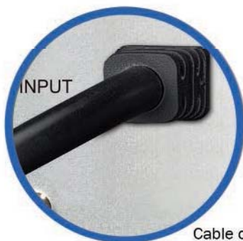
Cable de alimentación CA