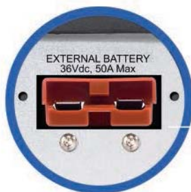
Entrada banco de baterías externas

Supresor de picos Protección de línea de datos