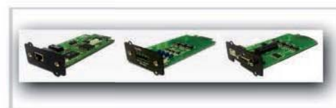
Tarjetas opcionales SNMP y de control