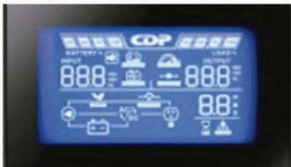
Muestra voltajes de entrada, salida, tiempos de autonomía y carga de batería